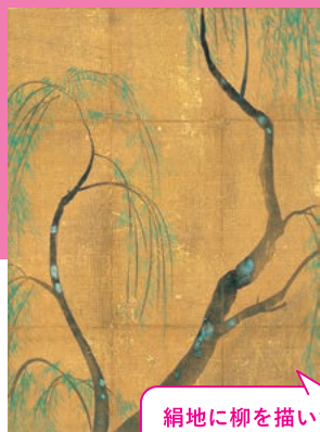
絹地に柳を描いた掛軸は、もともと香木片の包みだった。