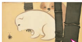
愛らしい2匹の子犬は、木版刷り図案の人気作。