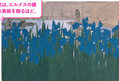
雪佳デザインの海外人気は、エルメスの雑誌の表紙を飾るほど。