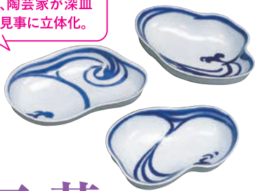
雪佳の水流模様を、陶芸家が深皿へ見事に立体化。