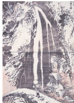
『七編』《信濃小野の滝》