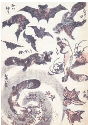
『二編』《ムササビ・蝙蝠ほか》