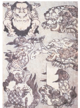
『八編』《天邪鬼・瑞獣》