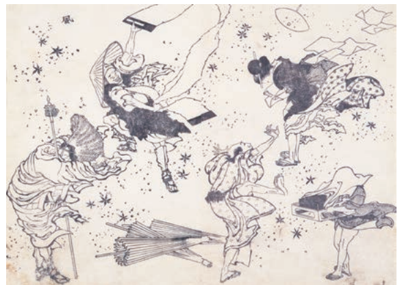
『十二編』《風のいたずら》