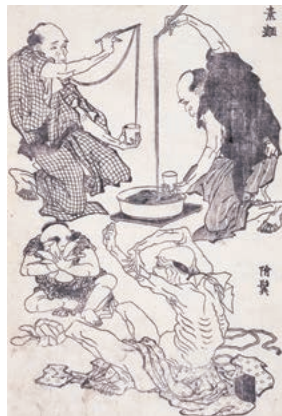
『十二編』《素麺・付け髪》