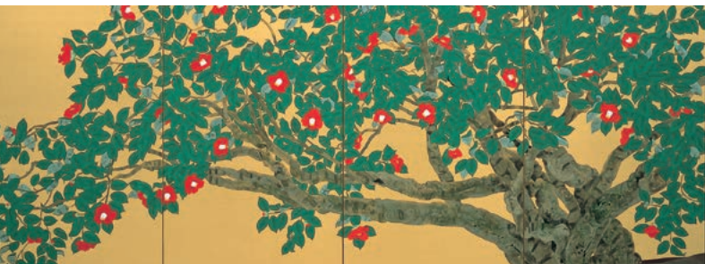
通期 中島千波《老樹三面叢椿》2005年