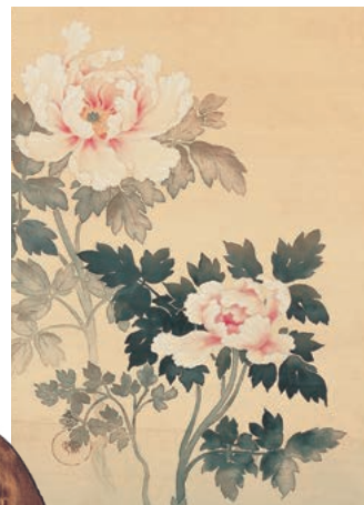
後期 菱田春草《朝之牡丹》部分 1906年 通期 池上秀畝《歳寒三友》1926年