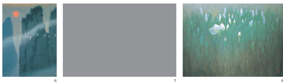
1. 通期 川合玉堂《溪村春雨》1942年 2. 通期 奥田元宋《多摩月照》1987年 3. 後期 菱田春草《声に白鷺・柳に白鷗》左隻 1903年頃 4. 通期 西郷孤月《月下飛鷺》1900年 5. 通期 横山大観《無我》1897年 6. 通期 大山忠作《蓬萊朝陽》1999年 7. 前期 加山又造《千羽鶴》1978年 8. 後期 那波多目功一《清晨》1998年 9. 通期 鍋木清方《涼宵》制作年不詳

みどころ 2 孤月、松園、清方、3点の新収蔵作品を初展示！ 岸壁の背から昇りくる朝日を描いた西郷孤月《日出元旦》。色香漂う夏の美人図、上村松園《盛夏》と鍋木清方《涼宵》。これらの新収蔵品を名品とともにお楽しみいただけます。※3点とも通期展示