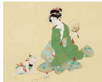
通期 上村松園《盛夏》部分 制作年不詳