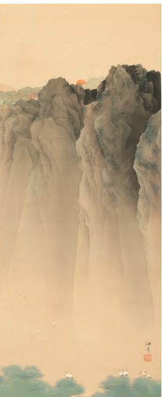
通期 西郷孤月《日出元旦》制作年不詳