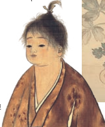
通期 横山大観《無我》部分 1897年