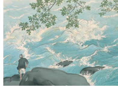
通期 川合玉堂《清湍釣魚》1949年頃