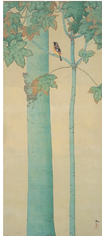
前期 菱田春草《桐の小禽》1908年頃