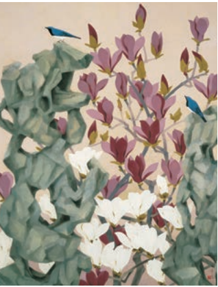
通期 山口蓬春《留園胎春》1958年