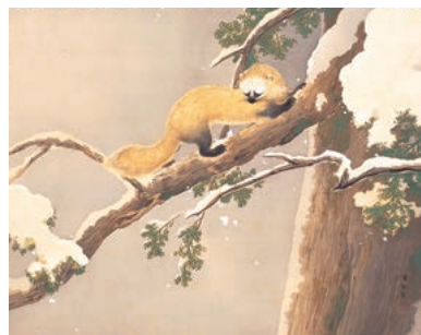
池上秀畝《春雪》制作年不詳