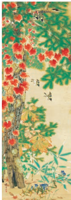
児玉希望《秋晴》1940年頃

花鳥画とは、四季折々の花木とともに鳥や動物、虫などの生き物を描いた伝統的な画題です。本展では花鳥画を中心に、草花や樹木をテーマとした近・現代の日本画で展示室を彩ります。たとえば、白梅に留まる一羽のシジュウカラが愛らしい松林桂月《早春》。また、豊かな色彩の花々と黒い呷々鳥の対比が鮮やかな池上秀畝《盛夏》など。あるいは紅葉した木々を描いた、児玉希望や伊東深水らによる秋の情景をご覧ください。