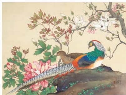
松林桂月《玉堂富貴錦鶏鳥》1935年