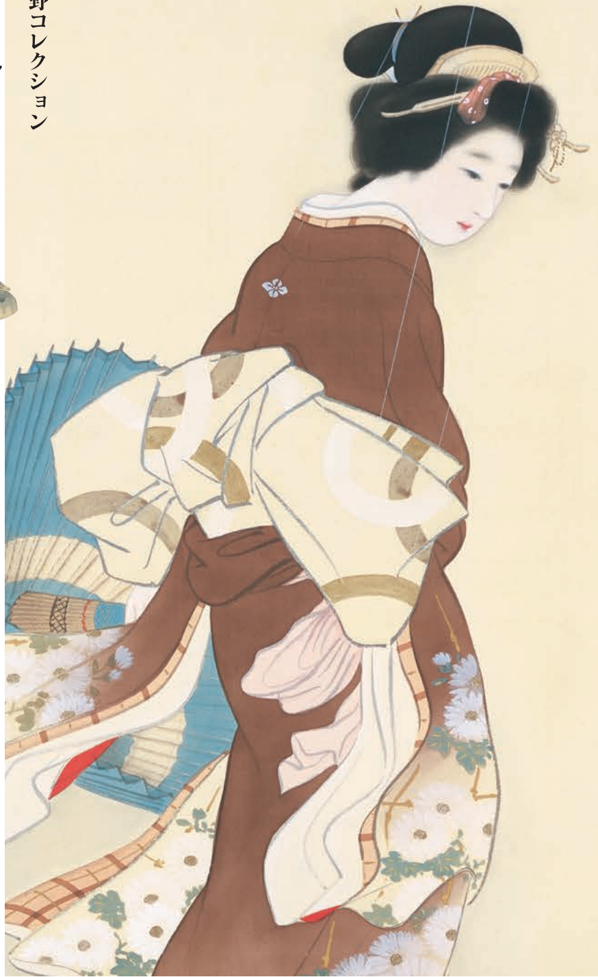
上村松園《志久礼》部分 昭和初期