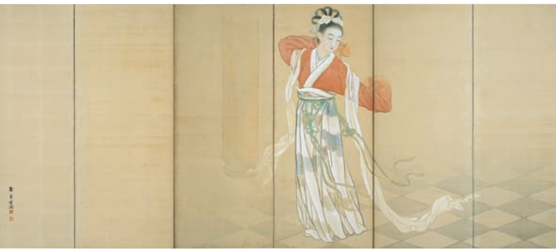
菊池梨月《歌舞図》1907年頃