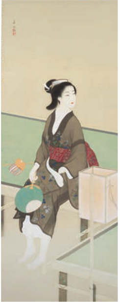
菊池華秋《夕涼み》1944年