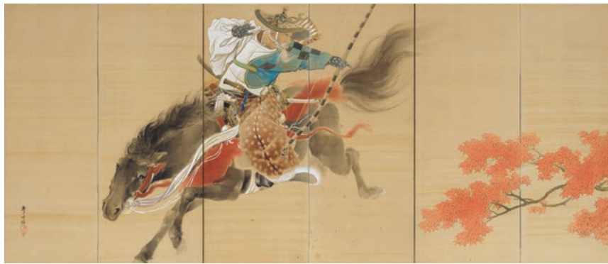
菊池梨月《流綱馬図》左隻 1902年頃