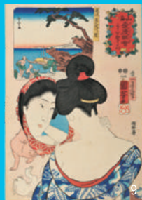
1.《猫の当字 ぶく》 2.《朝比奈小人嶋遊》 3.《通俗水滸伝豪傑百八人之志人 浪裡白跳張順》 4.《川中嶋百勇將戦之内 武田伊奈四郎勝頼》 5.《誠忠義士肖像 大星由良之助良雄》 6.《坂田怪童丸》 7.《東都三ツ股の図》 8.《山海愛度図会 はやく酔いをさましたい》 9.《山海愛度図会 えりをぬきたい》 10.《みかけハこゝろがとんだいゝ人だ》(部分)