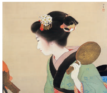
前期《鸞鷲蟹》1935年 個人蔵