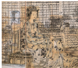
《楊貴妃 (下絵)》1922年 松伯美術館蔵