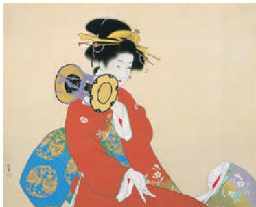
後期《鼓の音》1940年 松伯美術館蔵