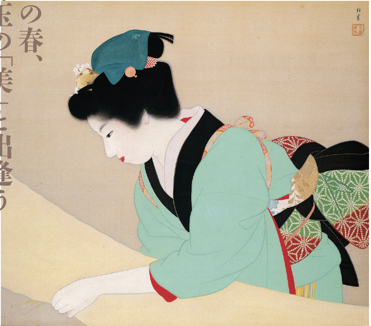
《晴日》部分 1941年 京都市美術館蔵