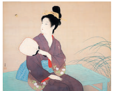
後期《蟹》1943年 西宮市大谷記念美術館蔵

※会期中、一部展示替えを行います（前期／4月14日～5月6日、後期／5月8日～5月27日）