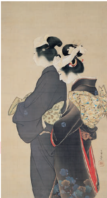
《人生の花》1899年 京都市美術館蔵