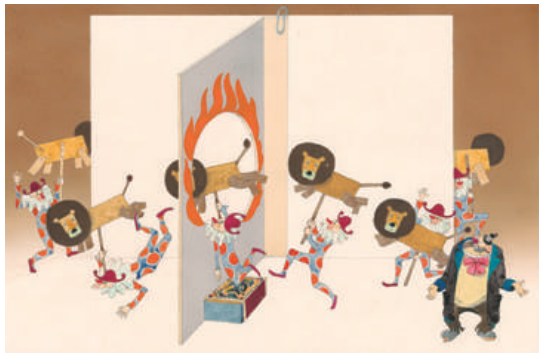
『ふしぎなさーかす』1971年