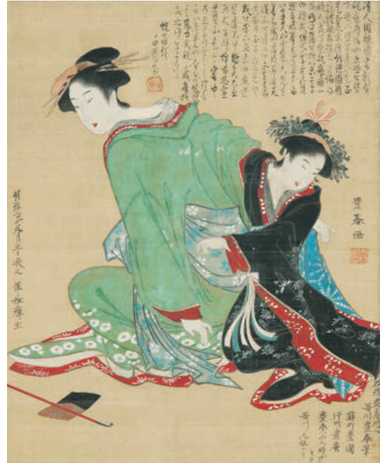
歌川豊春《遊女と禿》 寛政年間(1789~1801)頃