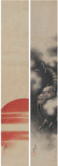
葛飾北斎《日 龍 月》 寛政12~文化5年(1800~08)