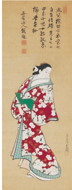
宮川長春《立ち美人》 正徳~享保年間(1711~36)