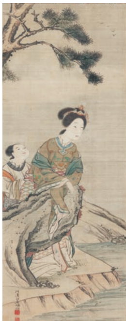
司馬江漢《唐美人》 天明年間(1781~89)