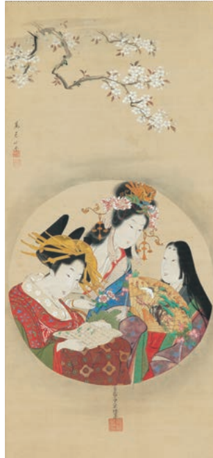
鳥園齋栄深、鳥君山《円窓の三美人》 寛政年間(1789~1801)