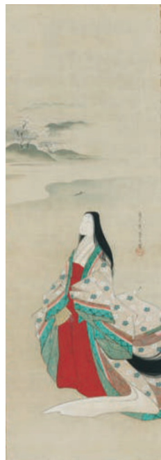
鳥文齋栄之《小野小町》 寛政年間(1789~1801)