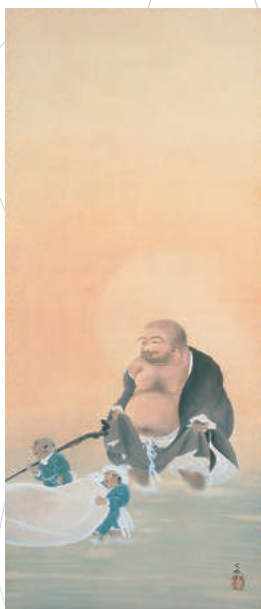
横山大観《布袋》1902~1906年頃