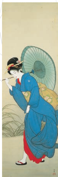
上村松園《追風》1935年頃