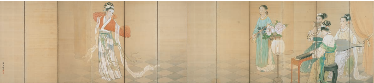
菊池契月《歌舞図》(部分) 1907年頃