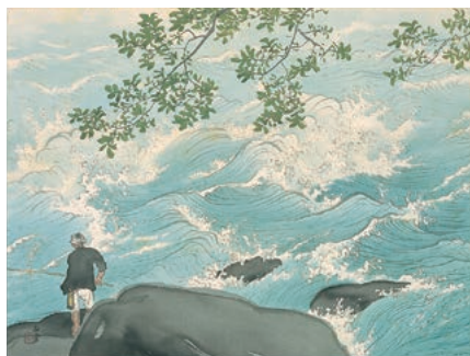
川合玉堂《清湍釣魚》1949年