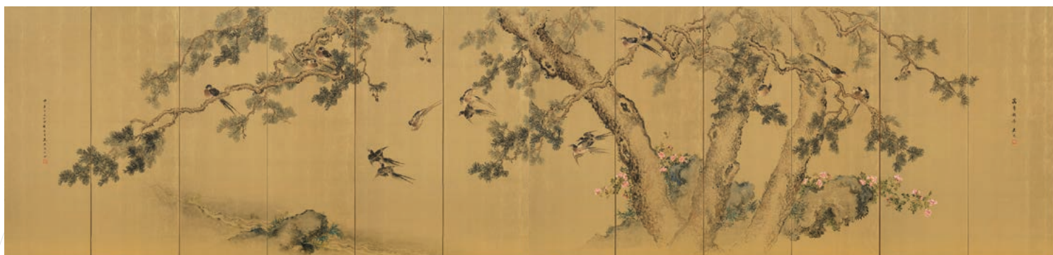
木村其樵《萬年報喜》1924年