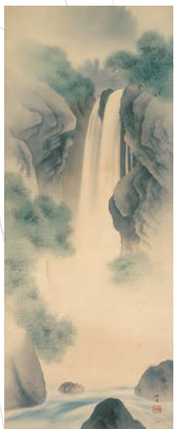
西郷孤月《照崖飛瀑》1899年頃