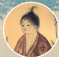
横山大観《無我》部分 1897年