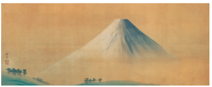
1. 菱田春草《芦に白鷺・柳に白鷗》1903年頃 2. 菱田春草《池辺飛鴨之図》1904年 3. 横山大観《無我》1897年 4. 横山大観《暁山雲》1919年 5. 横山大観《浪高し》1902年 6. 菱田春草《夏の山》1905年 7. 菱田春草《蓬莱山図》1900年頃 8. 横山大観・菱田春草《旭日静波》1901年頃 9. 西郷孤月《富士》1901年頃